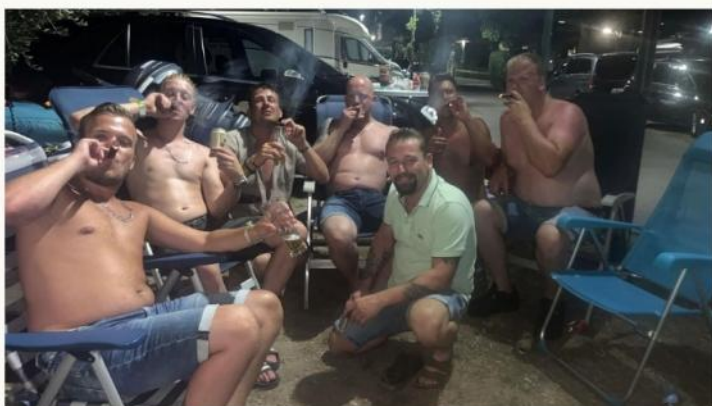
BIER DRINKEN MET VRIENDEN